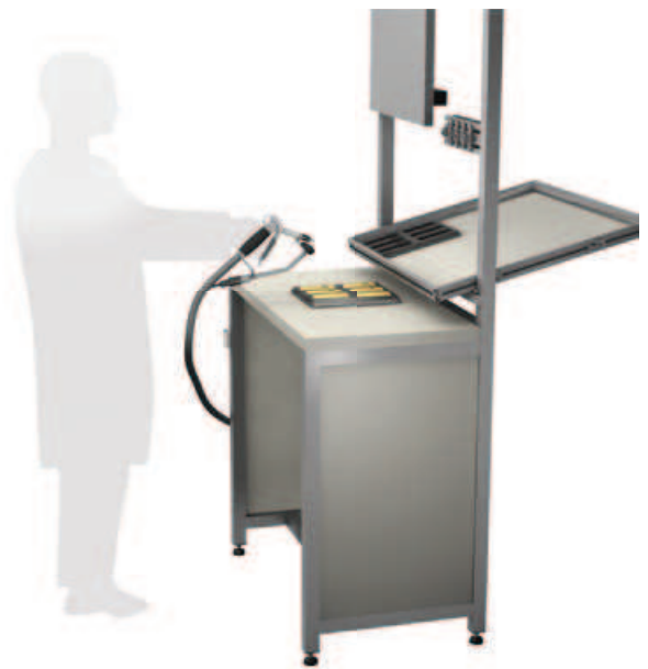
Arbeitsplatzbeispiel Example workplace