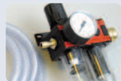
Filterregulventil Filter regulator valve