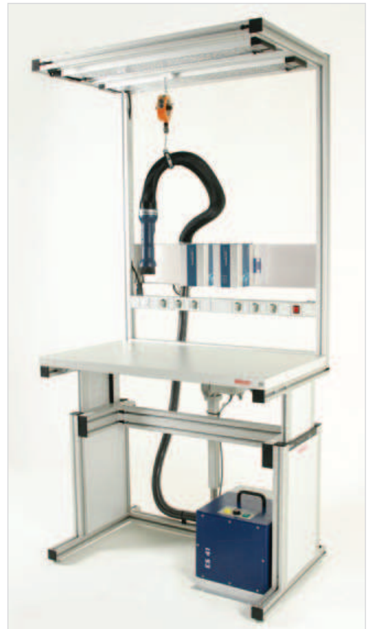
Arbeitsplatzbeispiel Example workplace

Dazugehöriges Zubehör finden Kapitel Zubehör. Corresponding accessories you can find in chapter Accessory.