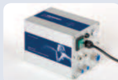
AIR CONTROL 11