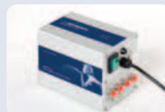
POWER UNIT 55 LED